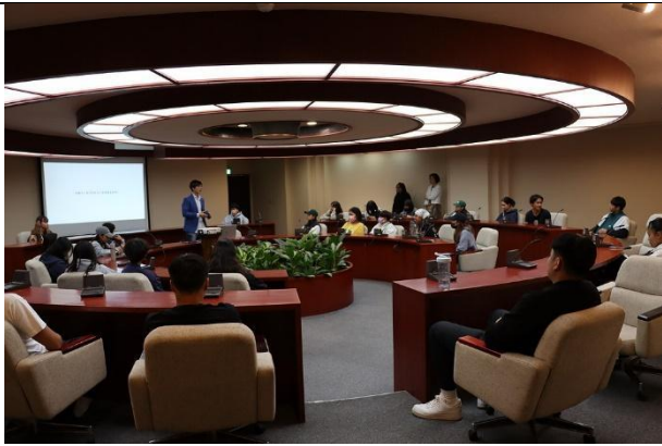
電視台開會辦公室