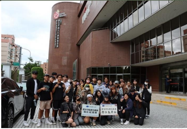
於原民台大門口合影

活動照片最少 6 張，每張需有照片說明，請排列於 A4 版面內，每張 A4 紙張排列直式 4 張或橫式 6 張照片(每張照片長寬比例要一樣，可設定寬度 8CM)。